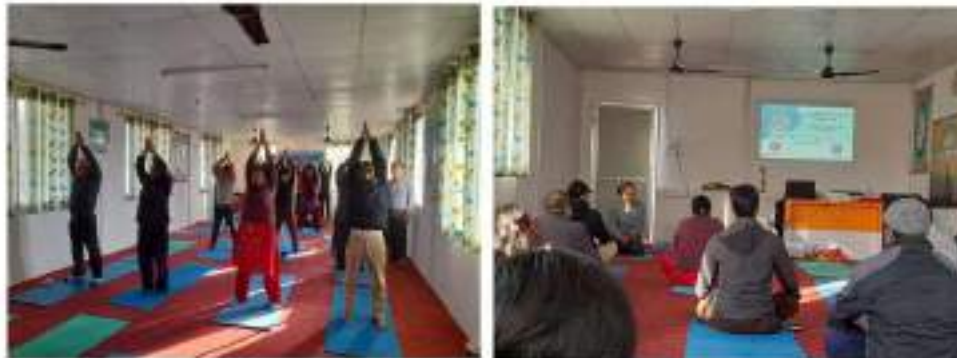
धौलागिरी आयुर्वेद औषधालय, नवलपरासी