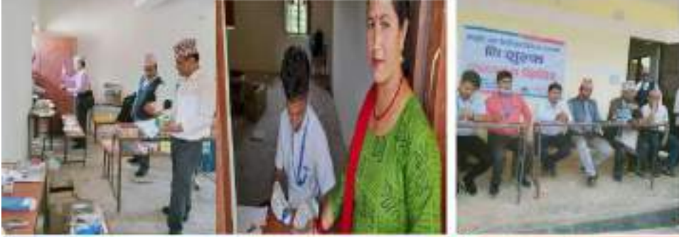
फैलागी आयुर्वेद औषधालय, बरगुडा

निशुल्क आयुर्वेद तथा वैकल्पिक चिकित्सा स्वास्थ्य शिविर स्थान: जमिनी न.पा.-५, विनामार मिति: २०७९/०३/०४ गते