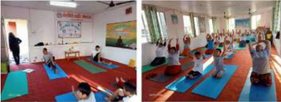
फैलागी आयुर्वेद औषधालय, बरगुडा

अन्तराष्ट्रिय योग दिवस कार्यक्रम मिति: २०७९ असार ७ (जून २१) गते स्थान: धौलागिरी आयुर्वेद औषधालय