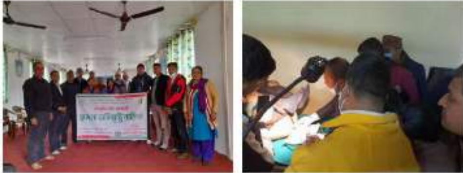
धौलागिरी आयुर्वेद औषधालय, नवलपरासी