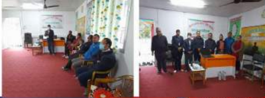
धौलागिरी आयुर्वेद औषधालय, नवलपरासी