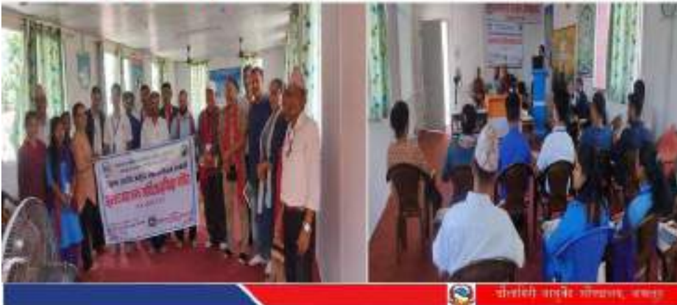
फैलागी आयुर्वेद औषधालय, बरगुडा

"आयुर्वेद सेवा सम्बन्धी सम्न्वय र वार्षिक समिक्षा तथा योजना तर्जुमा कार्यक्रम" मिति: २०७९/०३/३१