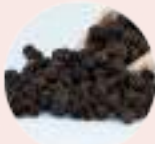
कटु (तृणिकी) Pungent

Concept of complete diet containing six different tastes