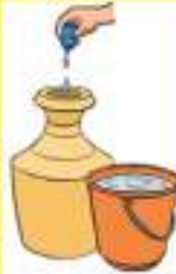
क्लोरीनद्वारा पानी निर्मलीकरण गर्ने