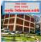
आयुर्वेद चिकित्सालय, नरदेवी