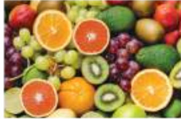
मौसम अनुसारका फलफूल