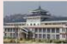
राष्ट्रिय आयुर्वेद अनुसन्धान तथा तालिम केन्द्र