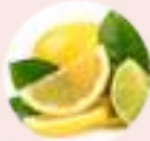
अम्ल (तृणिकी) Sour