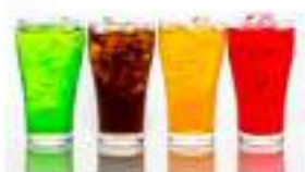
माइक पिप्य बरारथ