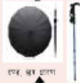
दण्ड, खुर छाया