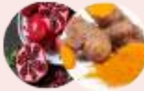
कषाय (तृणिकी) Astringent