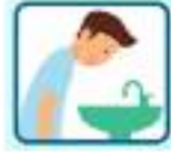
प्रक्षालन (हात धुनु)