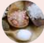
अवण (तृणिकी) Salt