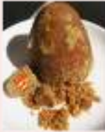
मधुर (तृणिकी) Sweet