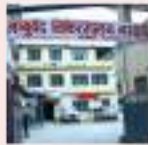
आयुर्वेद शिक्षण अस्पताल