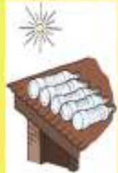
सफ्टिल अर्थात् घामले पानी शुद्धिकरण गर्ने विधि