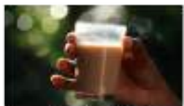
दैनिक पिया कफी