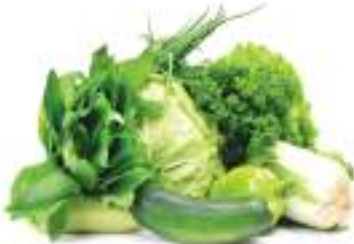
मौसम अनुसारका सागसब्जी